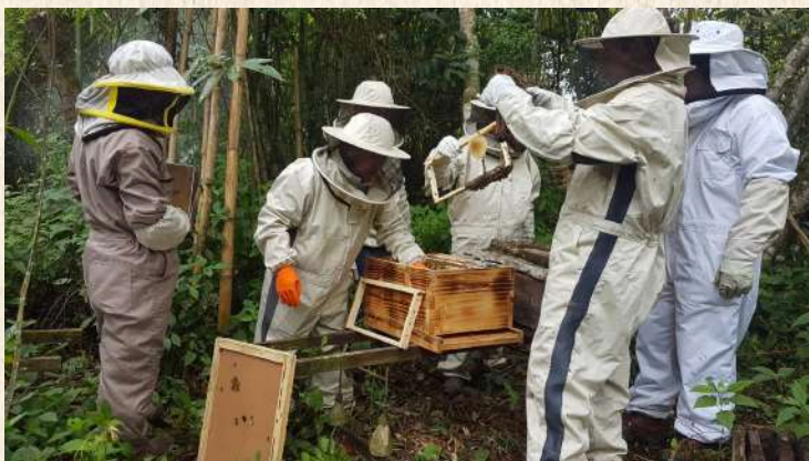
Inspección de colmenas