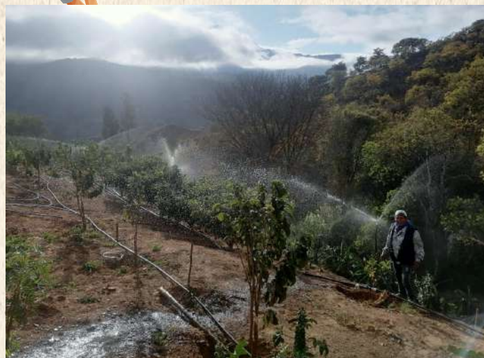
Implementación de sistemas de Riego