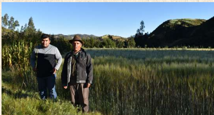
Investigación de cultivos anuales (Trigo)