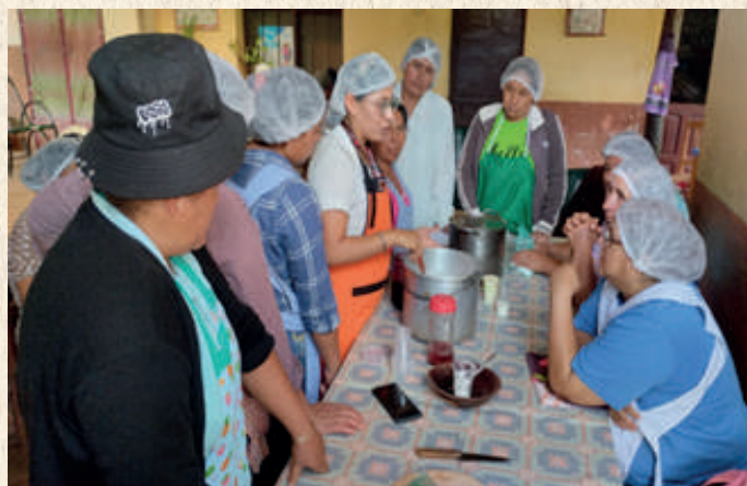
Transformación de lácteos