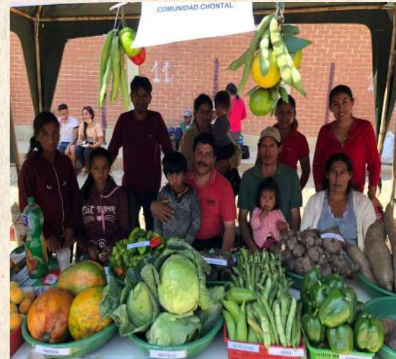
Promover la producción agroecológica