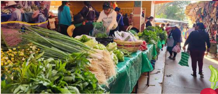
Comercialización de productos agroecológicos frescos / Aiquile

Impulsamos que las familias mejoren sus ingresos por la venta de productos agroecológicos frescos y procesados. Se les enseña diferentes preparados de comidas a partir de la producción. Desarrollamos prácticas de transformación de productos con valor agregado para autoconsumo y venta.