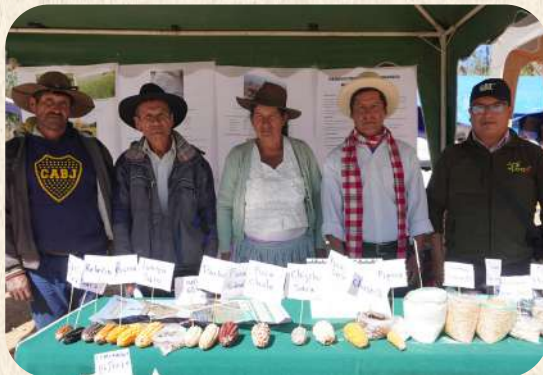
Participación de productores ecológi-