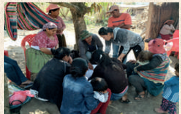
Capacitación LEY N° 341