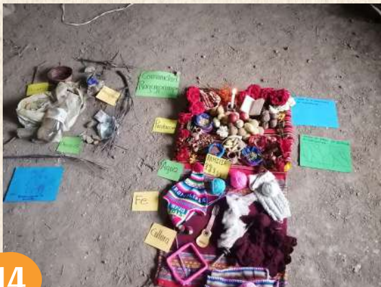
Reflexión de escasez de abundancia y escasez