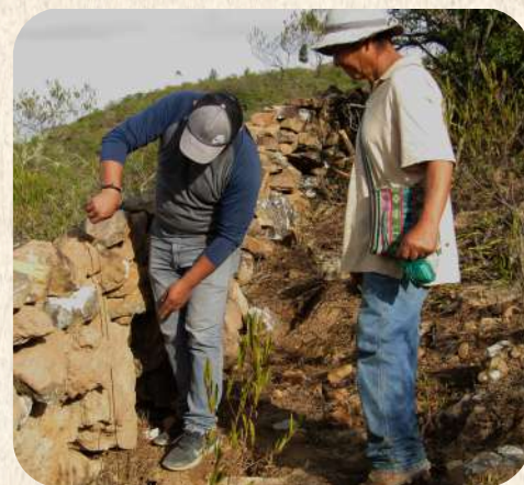
Protección de zonas de recarga hídrica en Pasorapa.