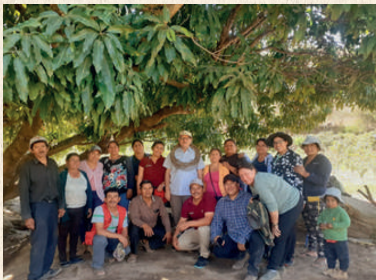
Familias beneficiarias de las comunidades