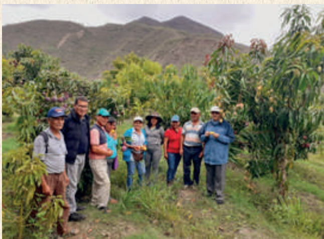
Parcelas agroforestales establecidas