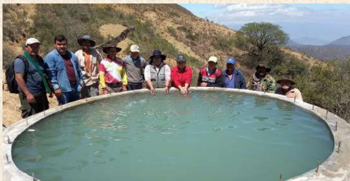
Construcción de depósitos circulares