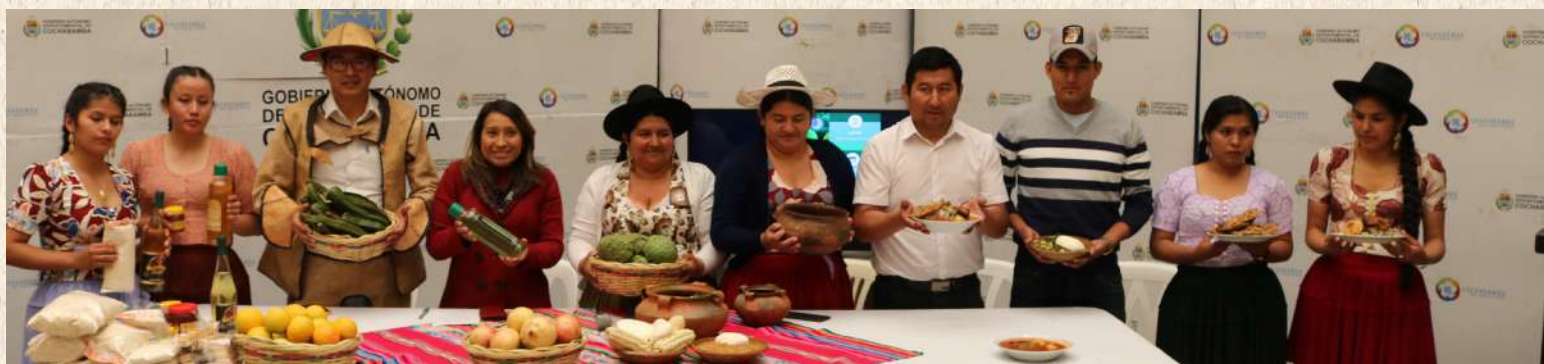
1ra. Cumbre Municipal de Seguridad Alimentaria Saludable y Nutricional con Soberanía - Aiquile.