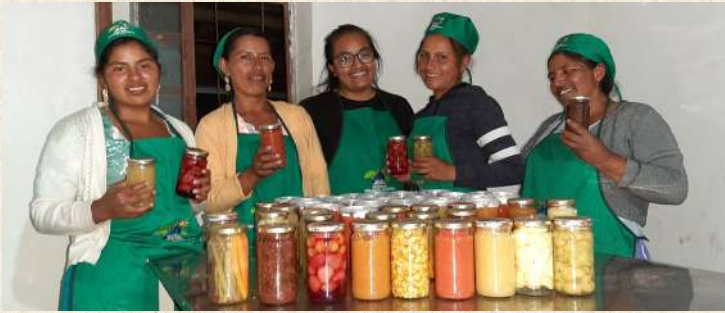
Trasformación de Alimentos