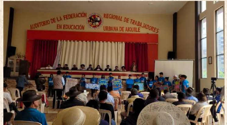
Apoyo en políticas públicas Municipales

Apoyamos en procesos de incidencia y reconocimiento de derechos a partir de las familias de las cuatro zonas de trabajo, para que ellos puedan realizar solicitudes de acuerdo a sus necesidades a los gobiernos Municipales. Realizamos encuentros de líderes comunales e intercambios de experiencias.