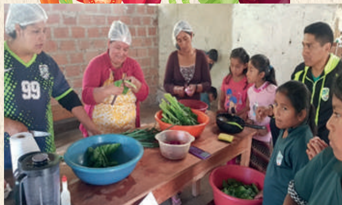
Preparación de comidas saludables