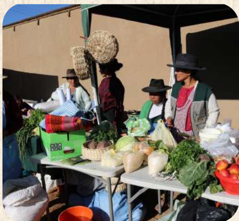
Feria Agroecológica en Pasora-