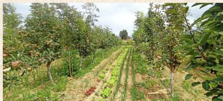
Producción de hortalizas en parcelas SAF