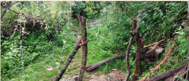
Protección de vertientes