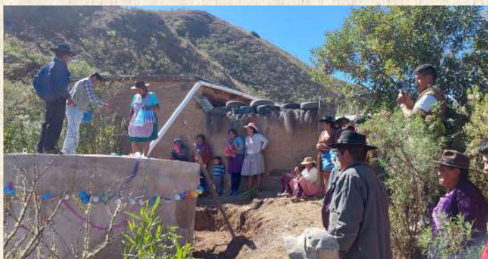
Construcción de aljibes

Promovemos investigación en la producción anual con nuevas semillas en parcelas que están en transición a un sistema agroecológico, implementación de parcelas SAF, construcción de depósitos circulares, aljibes, instalación de sistemas de riego, la diversificación de huertos de hortalizas, así mismo impulsamos la protección de áreas de recarga hídrica. Desarrollamos esas actividades como una medida resiliente al cambio climático que se vive en las cuatro zonas de trabajo: (Municipios de Aiquile, Totora, Pojo y Pasorapa).