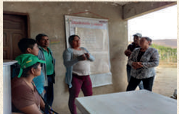
Capacitación de Empoderamiento y Liderazgo