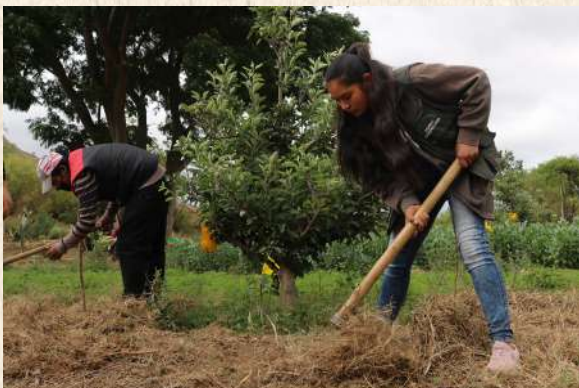
Jóvenes del TECSA Aiquile