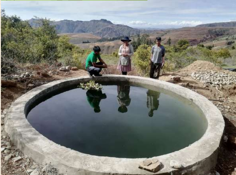
Reservorio tipo depósito circular